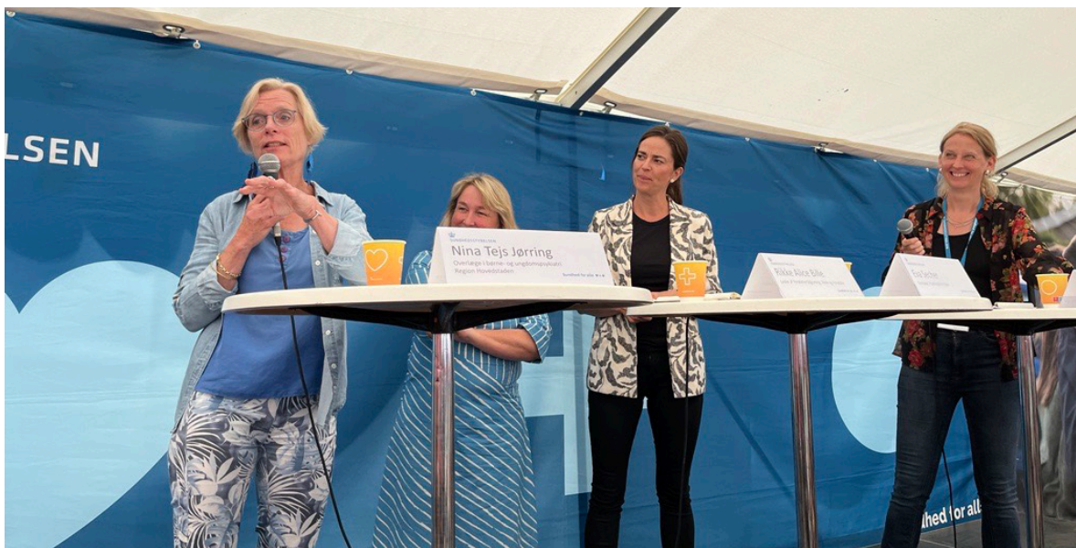
Foto: Paneldebat ved folkemødet på bornholm

Vi vil følge forhandlingerne tæt og have fokus på at placere os centralt i arbejdet frem mod at løfte opgaven. Regeringen har i første omgang fokus på Børne- og Ungepsykiatrien, men vi ved behovet er til stede til voksne autister med komorbiditet.