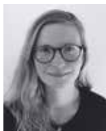
Af Sara Marie Dynesen, journalist.

EN SÆRLIGT TILRETTELAGT UNGDOMSUDDANNELSE (STU) ER FOR MANGE UNGE MED AUTISME ET STORT SKRIDT MOD SELVSTÆNDIGHED. FORLØBET UDVIKLER DE UNGES I PERSONLIGE, SOCIALE OG FAGLIGE KOMPETENCER, OG DER BLIVER TAGET FAT, DER HVOR POTENTIALLET HOS DEN ENKELTE ER STØRST.