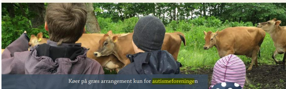
Køer på græs arrangement kun for autismeforeningen

Vores medlemmer er altid velkomne til at kontakte os og bakke op om kredsens arbejde ved at deltage i arrangementer og kurser. Vi tilbyder også bisidning. Man må altid foreslå emner eller udflugtsmål til bestyrelsen. På vores hjemmeside www.kredssydvest.dk kan man finde vores kontaktoplysninger, samt se hvilke arrangementer, der er planlagt.